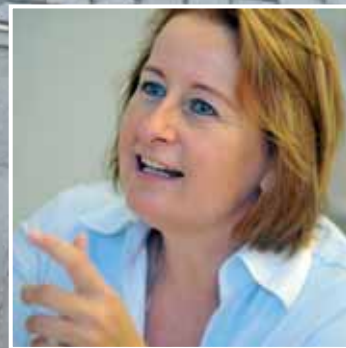
NL EVD Internationaal helpt uw export te stroomlijnen