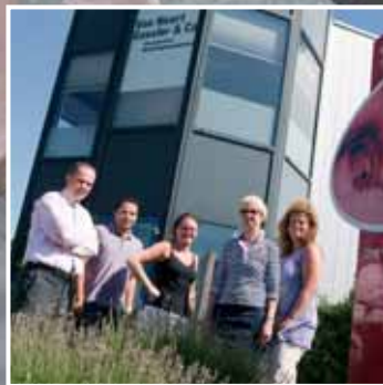
Van Noort Gassler & Co: solide accountantskantoor met roots in de Zaanstreek