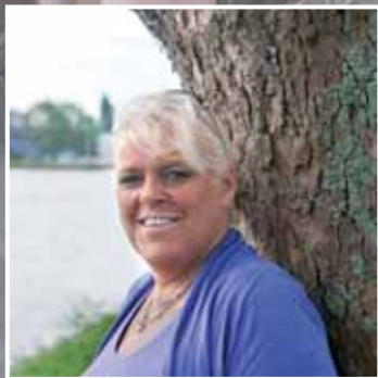
Francis Blok van Zaanstad Schilderwerken staat haar mannetje