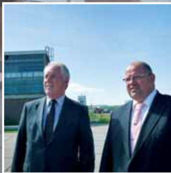
Revivre Projectmanagement B.V. brengt vastgoed en infra opnieuw tot leven